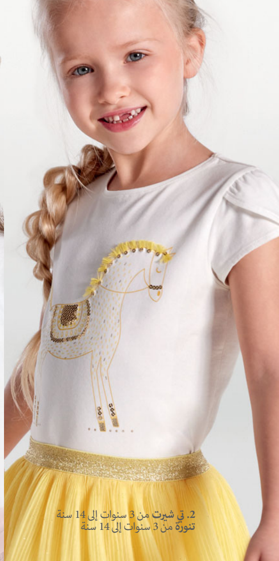
2. في شيرت من 3 سنوات إلى 14 سنة تنورة من 3 سنوات إلى 14 سنة