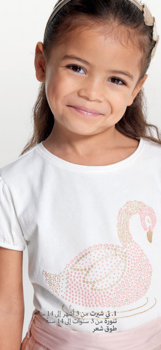
1. في شيرت من 3 أشهر إلى 14 سنة تنورة من 3 سنوات إلى 14 سنة طوق شعر