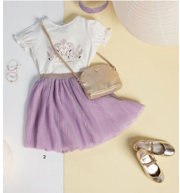
2. تي شيرت من 3 سنوات إلى 14 سنة تنورة من 3 سنوات إلى 14 سنة طوق شعر أساور حذاء باليرينا من مقاس 19 إلى مقاس 36