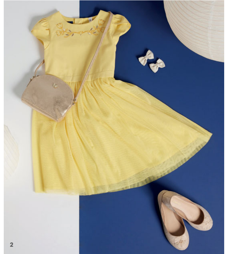
2. فستان من 3 سنوات إلى 14 سنة حقيبة دبابيس شعر حذاء باليرينا من مقاس 25 إلى مقاس 36