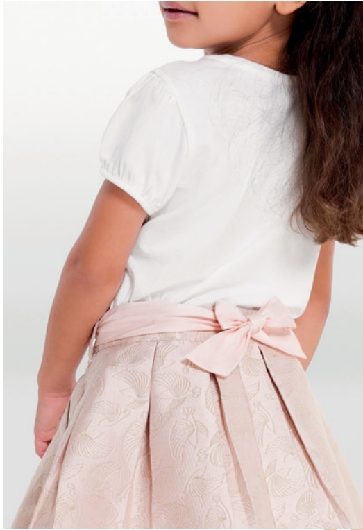
1. في شيرت من 3 أشهر إلى 14 سنة تنورة من 3 سنوات إلى 14 سنة