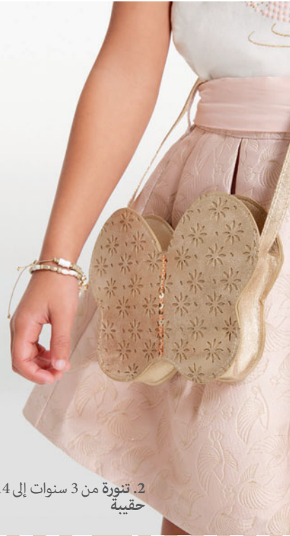
2. تنورة من 3 سنوات إلى 14 سنة حقبة