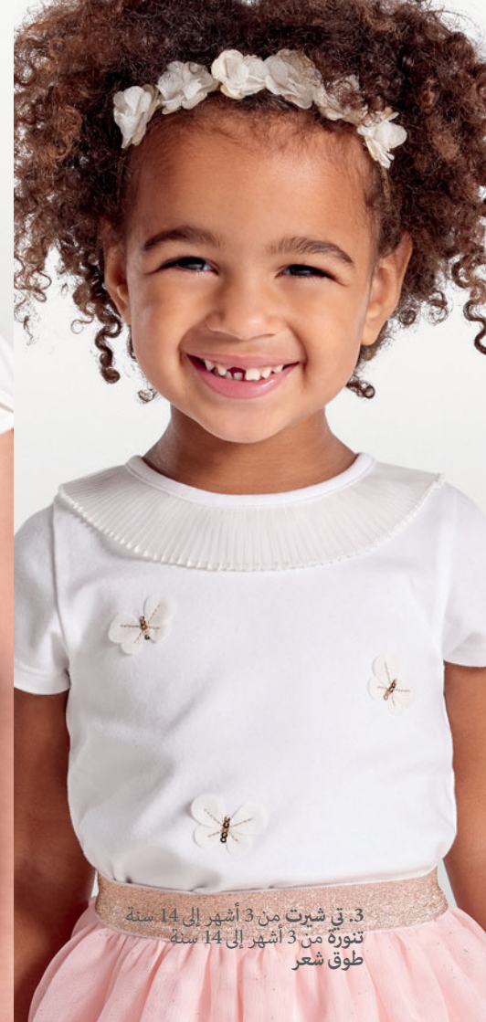
3. في شيرت من 3 أشهر إلى 14 سنة تنورة من 3 أشهر إلى 14 سنة طوق شعر