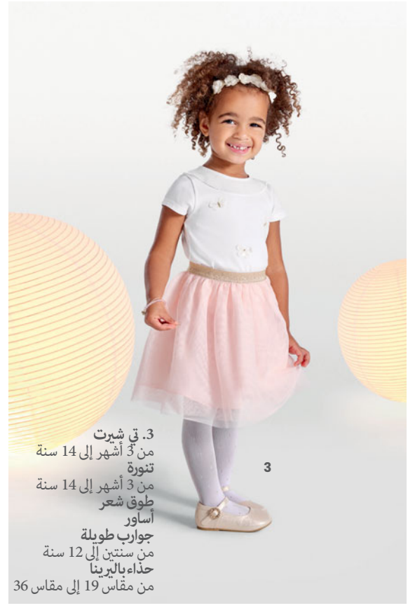
3. تي شيرت من 3 أشهر إلى 14 سنة تنورة من 3 أشهر إلى 14 سنة طوق شعر أساور جوارب طويلة من سنتين إلى 12 سنة حذاء باليرينا من مقاس 19 إلى مقاس 36