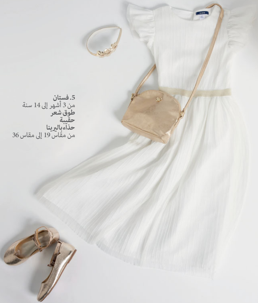
5. فستان من 3 أشهر إلى 14 سنة طوق شعر حقيبة حذاء باليرينا من مقاس 19 إلى مقاس 36