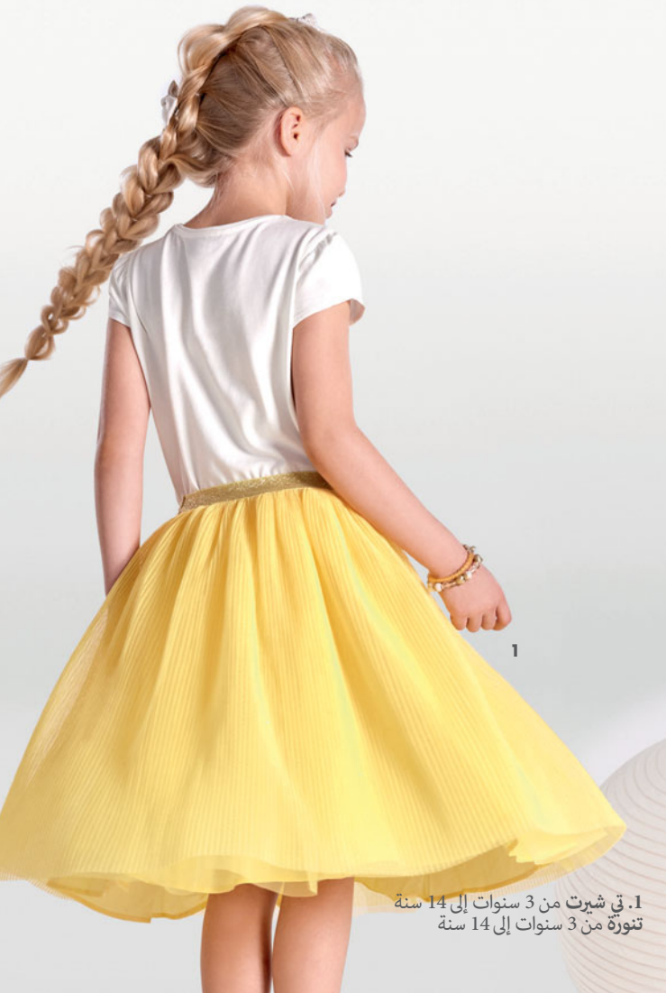
1. تي شيرت من 3 سنوات إلى 14 سنة تنورة من 3 سنوات إلى 14 سنة