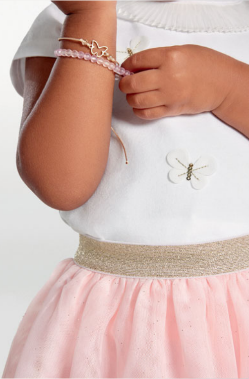
4. قى شيرت من 3 أشهر إلى 14 سنة تنورة من 3 أشهر إلى 14 سنة أساور