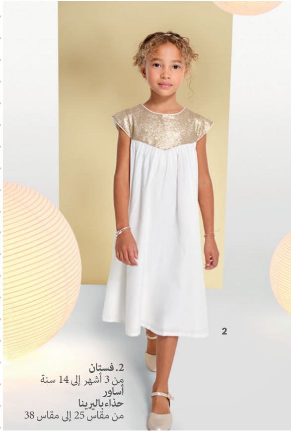
2. فستان من 3 أشهر إلى 14 سنة أساور حذاء باليرينا من مقاس 25 إلى مقاس 38