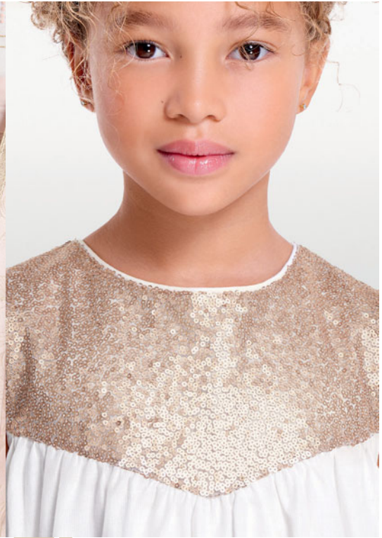
3. فستان من 3 أشهر إلى 14 سنة