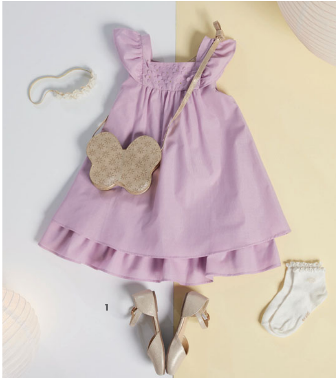
1. فستان من 3 أشهر إلى 14 سنة حقيبة رباط للرأس جوارب قصيرة (مجموعة تضم 3 قطع) من مقاس 23 إلى مقاس 38 حذاء باليرينا من مقاس 25 إلى مقاس 36